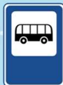
Место остановки автобуса и (или) троллейбуса

На дорогах пешеходам Стало проще с переходом Под землю даже площадь Перейти гораздо проще.