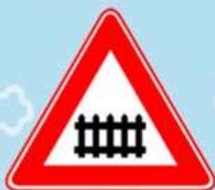
Железнодорожный переезд со шлагбаумом

Тут и вилка, тут и ложка, Подзаправились немножко. Накормили и собаку... Говорим: «Спасибо знаку!».