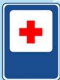
Пункт первой медицинской помощи

Знак висит у переезда, Беззаботности нет места. Тут шлагбаум не положен, Буду очень осторожен!