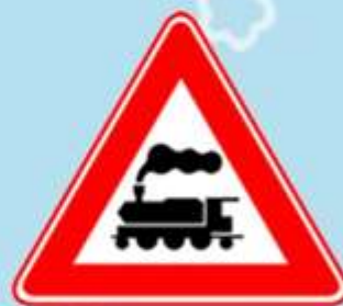
Железнодорожный переезд без шлагбаума

Ната с куклой в тревоге Нужен доктор им в дороге. Не смотрите грустным взглядом- Площадь близко, доктор рядом!